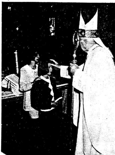
50 vasszécsenyi és tanakajdi fiatalat bérmált köz-ségünkben a megyéspüspök szeptember 10-én. Képünk az emlékező pillanatot örökítette meg.