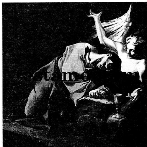
Tóth Csaba: Egy mindenkiért, mindenki egyért (1995)

Idő, tér s remény keserű keresztjén most könyörgünk: Atyám, bocsáss meg nekik! Mert lelkünk kihül, ha nem melengetik!