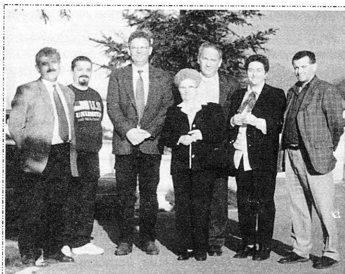
Képünkön a magyar küldöttség és a vendéglátók Algyógy egyik szállodája előtt

A háromnapos látogatáson a vendégszeretet nagyon jó benyomást tett a küldöttség tagjaira, a vendéglátók valóban minden megtettek azért, hogy a baráti kapcsolat elindulhasson, majd tovább erősödjön. Elkészítettek egy szándéknyilatkozatot is, hogy a két fél kezdeményezését írásban rögzítsék.