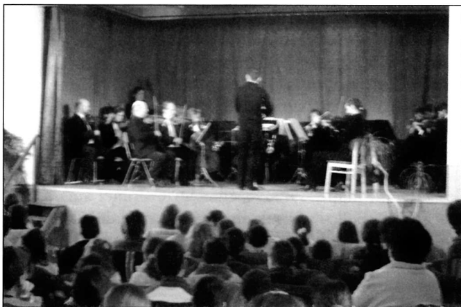
Koncert a tanakajdi művelődési házban