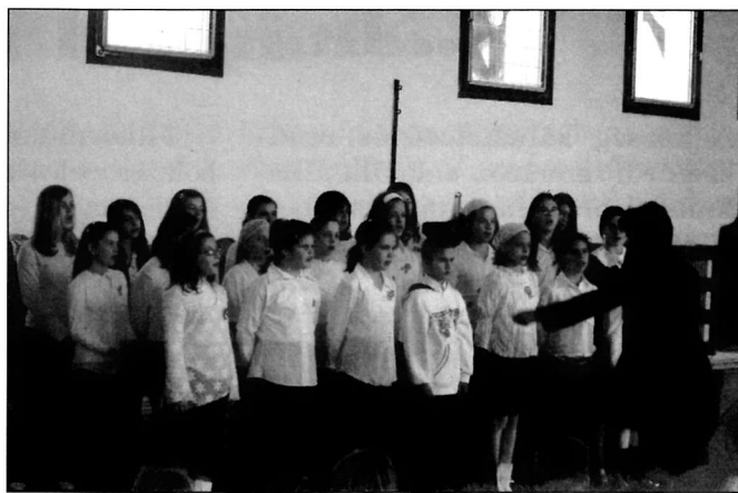
A községi karácsonyi ünnepélyen lépett fel énekkarunk nagy sikerrel.

Lucázás: 4.osztályos fiúk elevenítették fel Vasszécsenyben és Tanakajdon a karácsonyi ünnepkör egyik fontos eseményét.